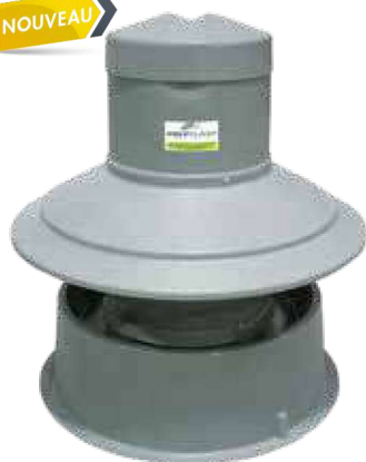
Nourrisseur 175 L Réf : NM175