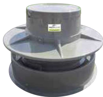
Nourrisseur Optimum Réf : NM356