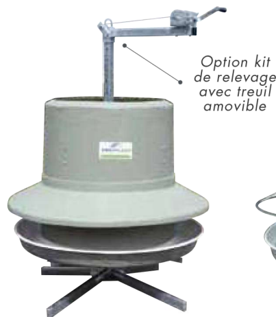
Nourrisseur 450 L avec auvent Réf : NM450RAU