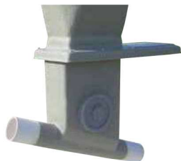
Boitard orientable de 0 à 45° sur tube Ø 300 avec trappe inox et tube de départ Réf : SBDVS1D