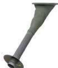
Goulotte extérieure avec trappe guillotine Ø 200 et collerette anti-pluie Réf : SGE200