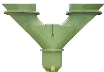
Boitard de jumelage Réf : SBJUTV