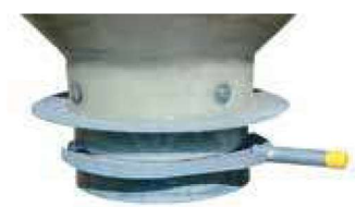
Trappe guillotine galva Ø 300 Réf : STG300