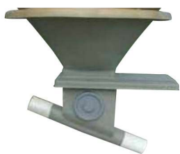
Boitard orientable de 0 à 45° sur collerette avec trappe inox et tube de départ Réf : SBDVS1D