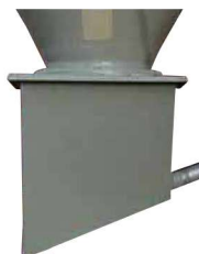
Boitard à dépression droit ou à 20° avec tube de départ Réf : SBD30D