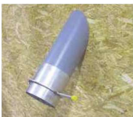
Goulotte intérieure avec trappe guillotine Ø 200 Réf : SGI200