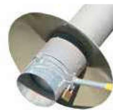
Goulotte d'ensachage avec trappe guillotine Ø 160 et collerette anti-pluie Réf : SGE160