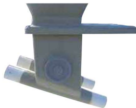
Boitard double orientable de 0 à 45° sur tube Ø 300 avec trappes inox et tubes de départ Réf : SBDVS2D