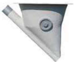
Boitard Ø 600 droit, à 20 ou 45° avec tube de départ Réf : SBPOLYVR