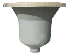
Boitard Ø 500 pour prise directe d'une vis Réf : SB500VR