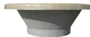
Adaptation pour boitard toute marque Réf : SABDIVS