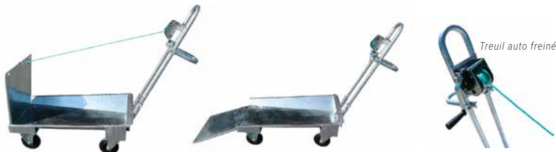
Treuil auto freiné