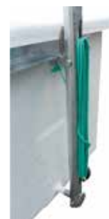
Système de verrouillage avec enroulement de la cordelette