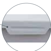
Clips de fermeture