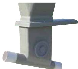
Boitard orientable de 0 à 45° sur tube Ø 300 avec trappe inox et tube de départ