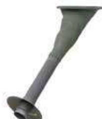
Goulotte extérieure avec trappe guillotine Ø 200 et collerette anti-pluie