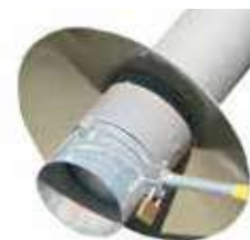
Goulotte d'ensachage avec trappe guillotine Ø 160 et collerette anti-pluie