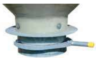
Trappe guillotine galva Ø 300