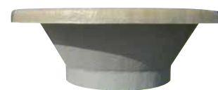
Adaptation pour boitard toute marque