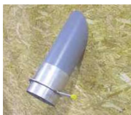
Goulotte intérieure avec trappe guillotine Ø 200