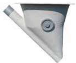
Boitard Ø 600 droit, à 20 ou 45° avec tube de départ