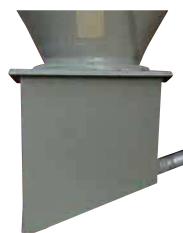
Boitard à dépression droit ou à 20° avec tube de départ