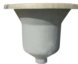
Boitard Ø 500 pour prise directe d'une vis