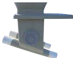
Boitard double orientable de 0 à 45° sur tube Ø 300 avec trappes inox et tubes de départ