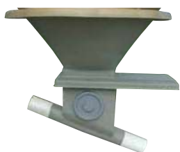
Boitard orientable de 0 à 45° sur collerette avec trappe inox et tube de départ