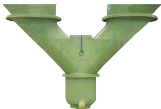
Boitard de jumelage